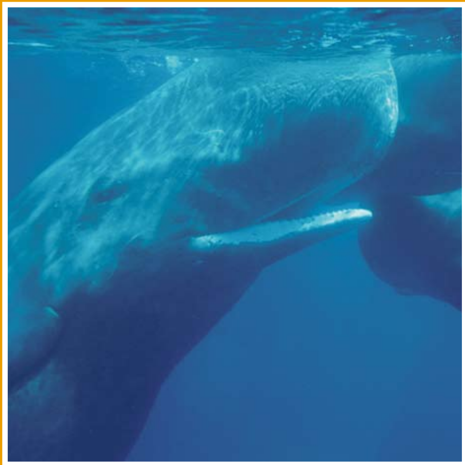
Cachalot (Sperm whale), Méditerranée, 1998