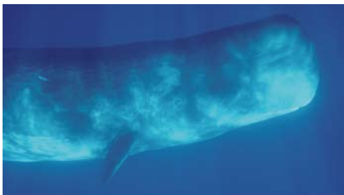
Le melon d'un Cachalot: un très gros sonar.

Chez les mysticètes, la bouche et les fanons sont adaptés à la capture de crustacés mesurant de quelques millimètres à quelques centimètres de longueur, voire de petits mollusques (Baleine grise). Les Baleines franches sont des "filtreuses": elles écument la surface en nageant dans un nuage de zooplancton, avec la bouche entr'ouverte. Les copépodes (crustacés) de quelques millimètres rentrent avec l'eau à l'avant de la bouche, et sont retenus par les fanons lorsque l'eau sort sur les côtés de la bouche. Les rorquals et le Mégaptère sont des "engouffreurs": après avoir repéré un nuage très dense d'euphausiacés (crustacés) ou de petits poissons, ils se précipitent la bouche grande ouverte en engouffrant des tonnes du mélange. Ensuite, la bouche fermée, les balénoptères expulsent l'eau à travers les fanons et conservent la précieuse nourriture.