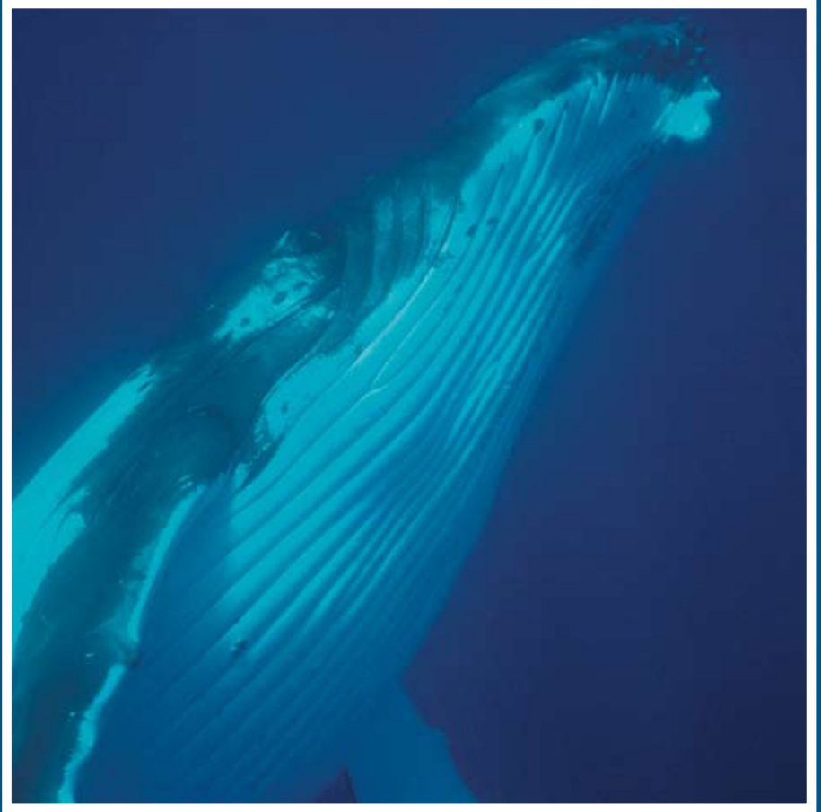
Mégaptère (Humpback whale), Tahiti, 1999