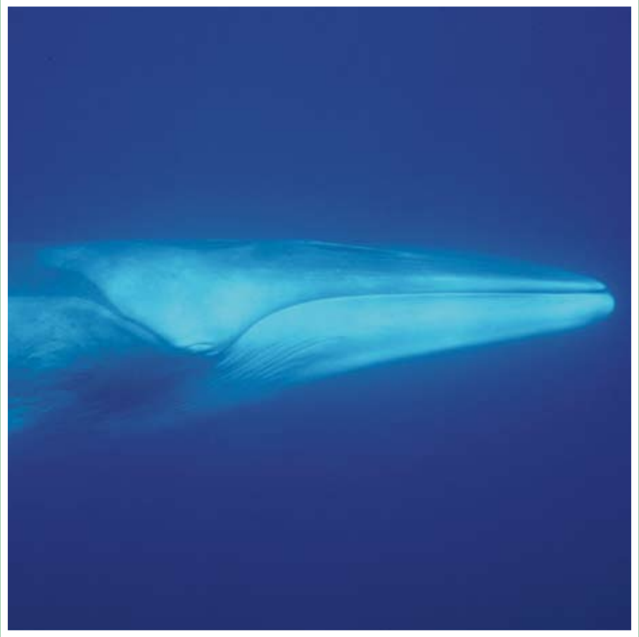
Rorqual commun (Fin whale), Méditerranée, 1992