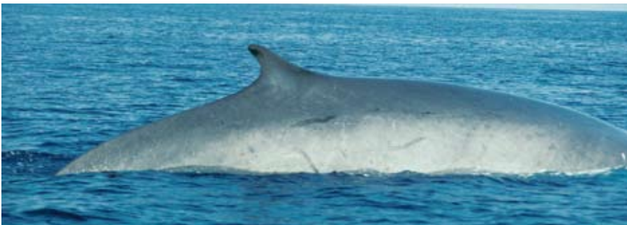
La sonde accentuée du Rorqual commun, durant son activité de chasse.

basse fréquence, pratiquement inaudibles pour l'homme. La journée estivale du rorqual est organisée sur un cycle combinant la prédation, le repos, des déplacements et quelques échanges sociaux (poursuites, sauts, nage en formation serrée). Bien que la prédation soit surtout nocturne, il n'est pas rare de voir des rorquals chasser tard dans la matinée ou dès le milieu d'après-midi : dans ce dernier cas, les sondes peuvent être profondes (plus de 500 m) et longues (plus de 18 minutes). L'activité du rorqual se traduit par des cycles sonde-surface assez stéréotypés : sondes assez longues avec séquences de respirations serrées pour la chasse, ou sonde de durée plus faible avec peu de respirations, pour le repos. Selon le cas, les rorquals peuvent se montrer curieux voire joueurs avec les voiliers qui les approchent.