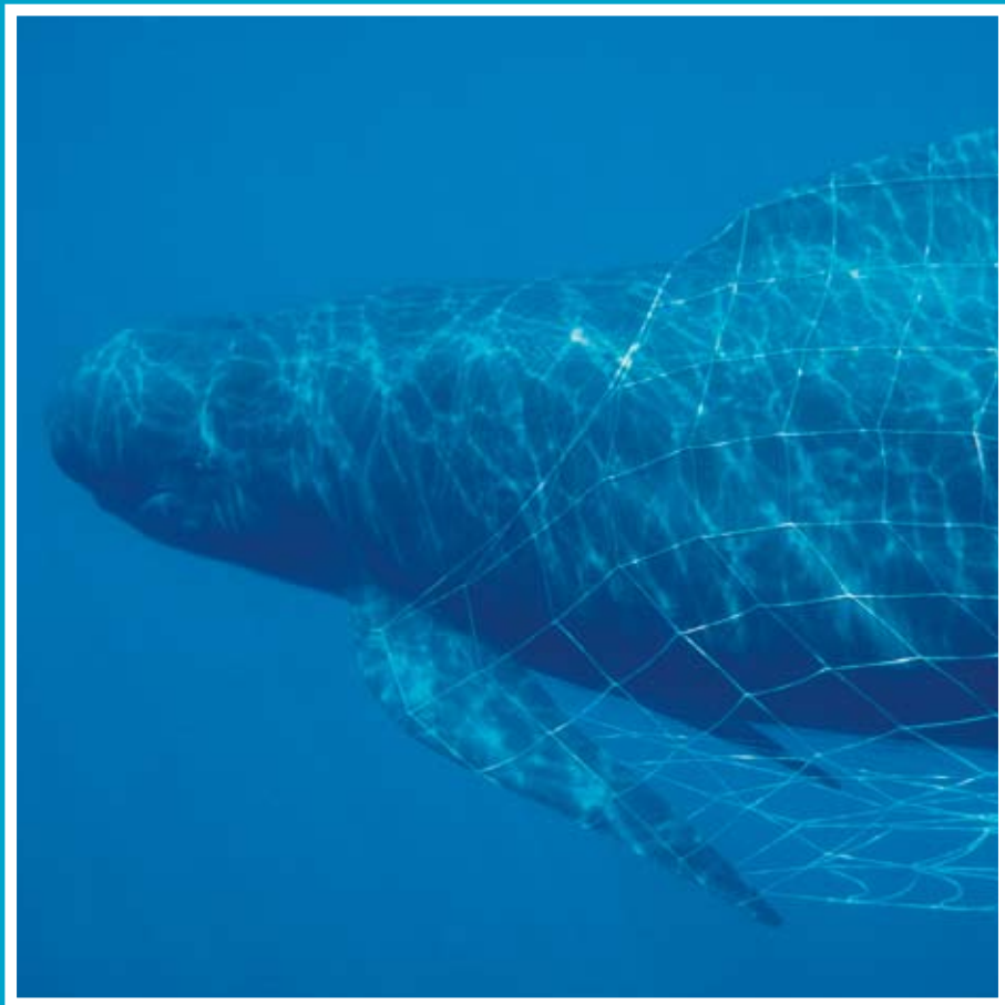
Globicéphale et filet dérivant (mer Ligure, 1992)